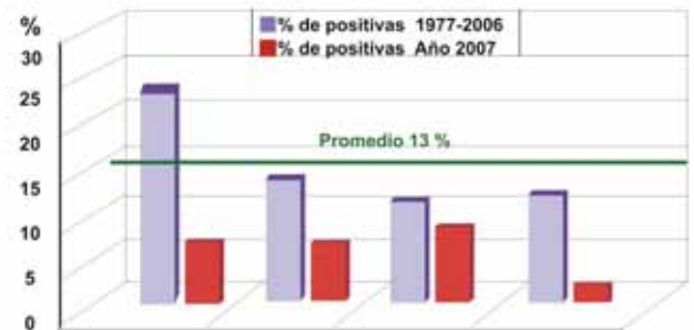
DISTRIBUCION PORCENTUAL ESTACIONAL DE CARBUNCLO en bovinos muertos súbitamente durante los años 1977 - 2007

La importante sequía que afectó casi todo el territorio de la Pcia de Bs. As. durante la temporada invierno-primavera, posiblemente influyó sobre la disminución del número de brotes de carbunclo (gráfico 2). Fue llamativo que durante la primavera no se produjera ningún brote de Carbunclo, siendo ésta la primera oportunidad que ocurre desde que se inició el seguimiento. El período invernal también se mostró atípico, el 43% de los aislamientos del año se produjeron en ese periodo. Lo habitual es que la mayor cantidad de brotes ocurran en el periodo verano-otoño. Posibles influencia de "cambios climáticos", modificarían hechos epidemiológicos futuros, razón más que importante para avanzar con estudios multidisciplinarios sobre el tema (4)