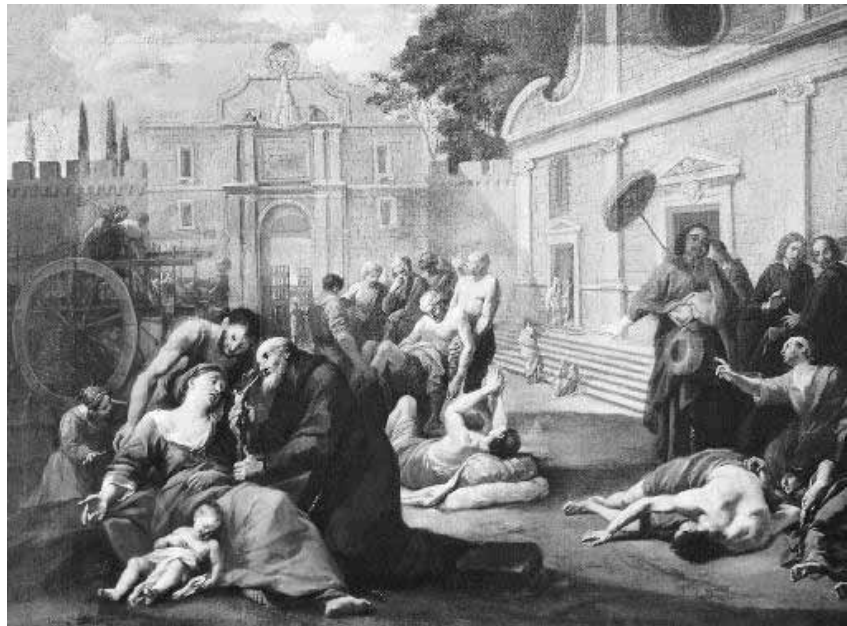
Ilustración de la Peste Negra

La Peste Negra, o simplemente La Peste del Siglo XIV , dejó 25 millones de personas muertas, equivalentes a un cuarto de la población mundial.