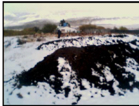
Pila alta 1,5m