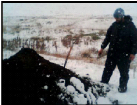
Siembra de lombrices