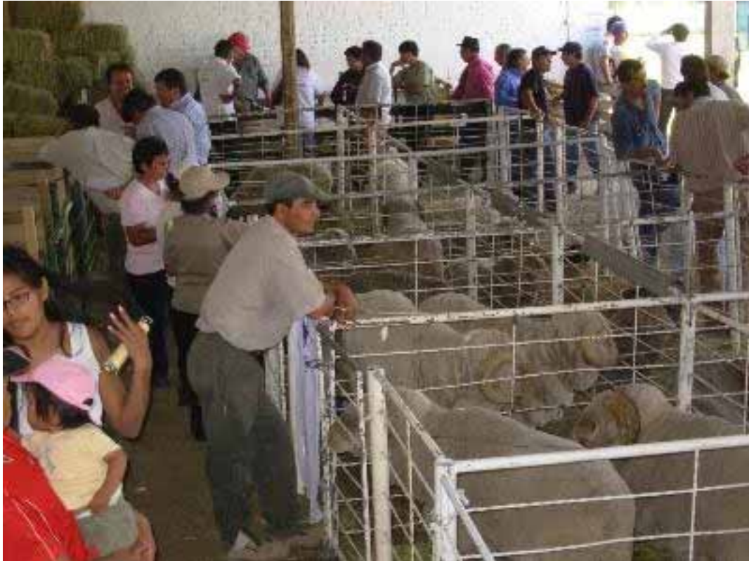
Exposición en la Sociedad Rural de Maquinchao Provincia de Río Negro. 25 a 28 de Febrero 2010

En fin, no estoy diciendo que REDVET debe ser una publicación panfletaria, seguramente los que mucho declaman nada hacen. Lo que digo es que nuestra profesión puede hacer mucho por sus semejantes y así como nosotros buscamos difundir nuestra experiencia, nuestros logros en el clínica y cirugía de perros y gatos, otros pueden hacerlo en planificaciones y acciones llevada a cabo o ideadas para ponerlas en práctica, acerca de lo que he hablado y en aparente contradicción con lo dicho cuando nos toque relacionarnos con políticas, políticos, funcionarios..., ahí actuemos como ciudadanos pero enfocándolo como veterinarios o sea luchando a favor de estas ideas, no ser solidarios con la lengua, sino con la acción.