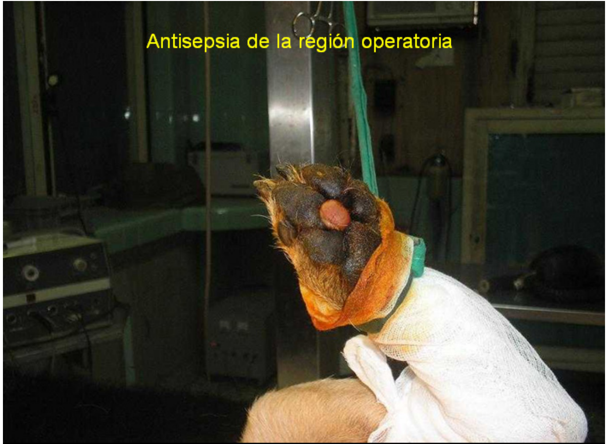
Antisepsia de la región operatoria