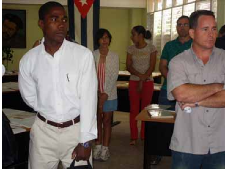
Ponencias orales y discusión de los trabajos en mesa