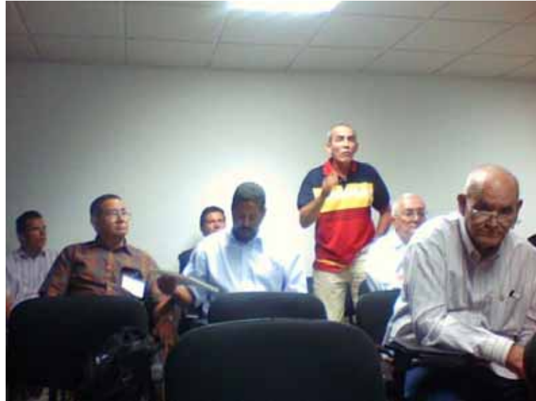
Asistentes en distintas sesiones de trabajo