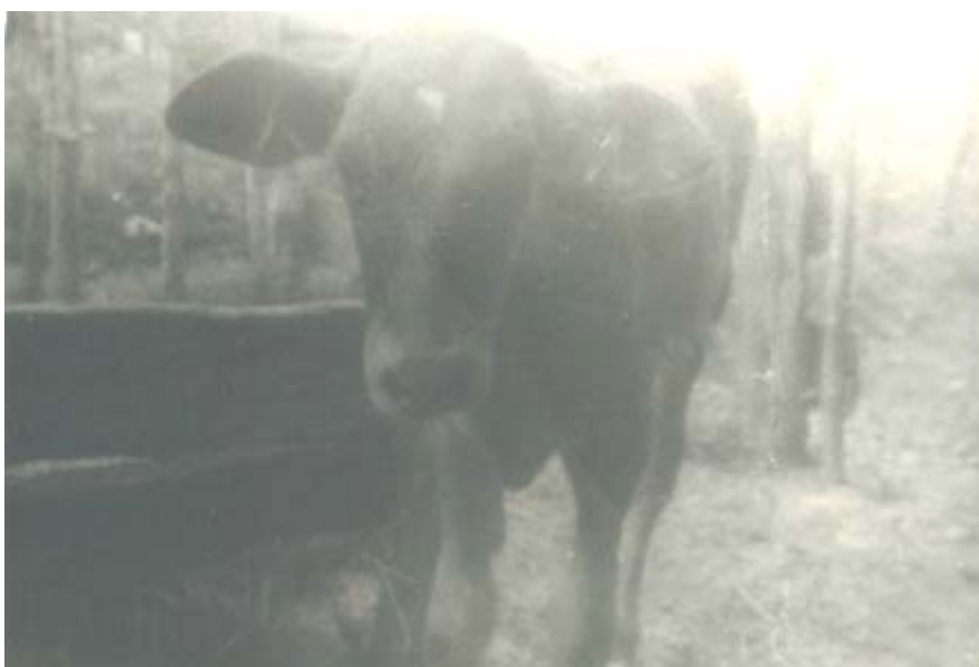
Fig. 1. Ternero macho (original)

Durante el estudio se pudo conocer que los tres terneros eran hijos de un mismo toro del cruce racial \frac{5}{8} Holstein x \frac{3}{8} Cebú y de hembras \frac{3}{4} Holstein x \frac{1}{4} Cebú pertenecientes a la misma línea filial paterna (esquema). Las madres eran de primer, segundo y cuarto partos respectivamente. Comprobamos que las inseminaciones fecundantes ocurrieron en un período de 42 días en unidades bovinas diferentes: un centro de novillas "A", una lechería de novillas "B" y una lechería "C".