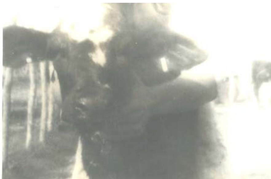
Fig. 2. Ternero hembra (original)

Según el sistema de explotación establecido en la empresa, las novillas son concentradas en la unidad "A" donde son inseminadas, pasan los primeros seis meses de la gestación tras los cuales se trasladan a la unidad "B", donde paren, pasan la primera lactancia y se gestan las hembras de primer parto trasladándose a los seis meses a la unidad "C",