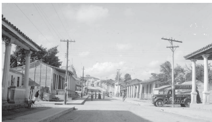
Avenida León Cuervo Rubio (Calle Retiro), año 1946