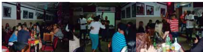
Instantáneas de las celebraciones por Fin de Año en nuestra Asociación

(Esta carta fue enviada por correo postal a cada uno de los miembros de nuestra Asociación en la víspera de fin de año)