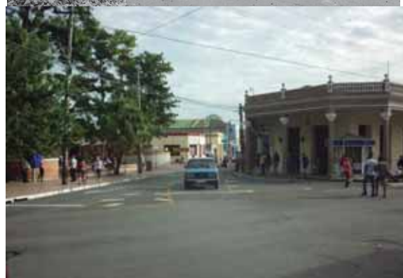
Calle Velez Caviedes, año 2017