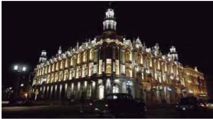
Gran Teatro de La Habana “Alicia Alonso”