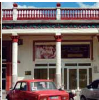
Detalles de la fachada de nuestra Sede Social con la tarja y la réplica del óleo