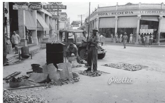
Calle Velez Caviedes, año 1955