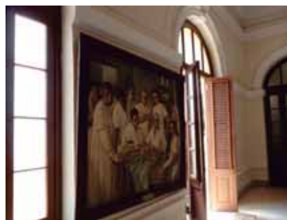
Óleo original en la sala científico-técnica de la Academia de Ciencias de Cuba

Los invitamos a que nos visite, donde seguro será acogido con esa mezcla de historia, ciencia y arte que tanto reconforta al ser humano.